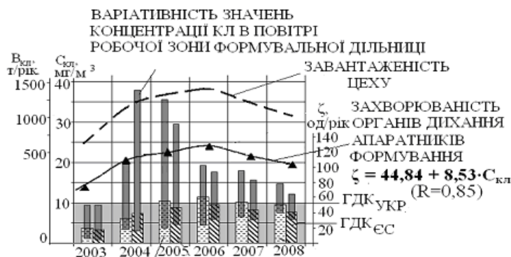
Рис. 1. Динаміка захворюваності органів дихання апаратників формування, забрудненості повітря робочої зони та навантаженості виробництва

Обробка даних ВАТ „Чернігівське хімволокно” за 2003-2008 рр. показала, що захворюваність органів дихання працюючих прямо пропорційна концентрації капролактаму в повітрі ( C_{\text{кл}} ):