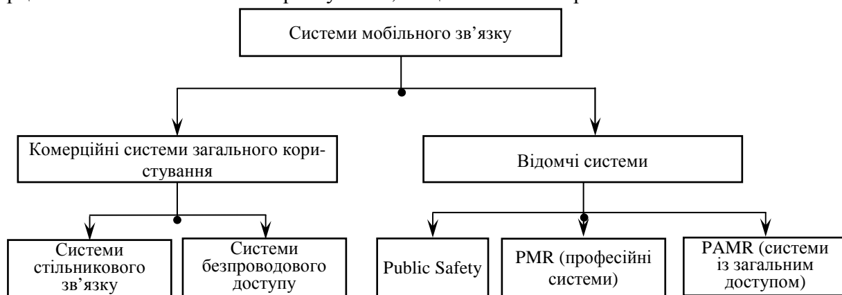
Рис. 2. Класифікація систем мобільного зв'язку

За призначенням системи мобільного зв'язку можливо розділити на відомчі й комерційні системи загального користування, як це показано на рис. 2.