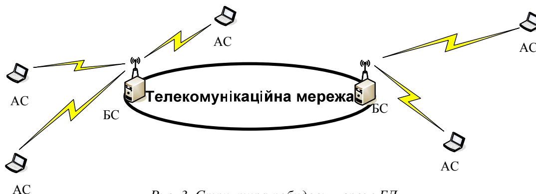
Рис. 3. Структура побудови мереж БД

Кожна з абонентських станцій (АС) має вільний вихід до телекомунікаційної мережі через радіоінтерфейс з базовою станцією (БС). Це забезпечує можливість обміну потоками даних як між АС, що знаходяться в зоні дії однієї БС, так і між АС, які знаходяться в робочій зоні різних БС. Всі БС з'єднані між собою через телекомунікаційну мережу. Це дозволяє забезпечити доступ до інших мереж, у тому числі і до всесвітньої інформаційної системи загального доступу Інтернет.